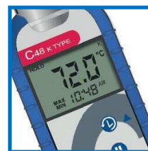
Maksimi/Minimi toiminto muistaa korkeimman ja matalimman lämpötilan