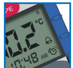
Ajastin ja hälytystoiminnot