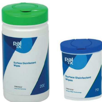
Desinfiointiliinat · PW70T - 70 kpl pakkaus · PW200T - 200 kpl pakkaus