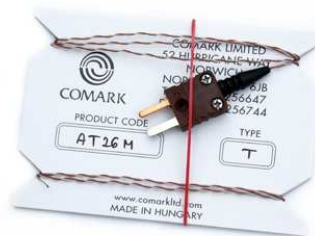
AT26M taipuisa ilma-anturi · alue: -40 ... +150 °C · 1.0 m · T-tyyppin termoparianturi