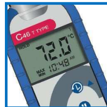
Maksimi/Minimi toiminto muistaa korkeimman ja matalimman lämpötilan