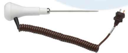
PT22M/W puikkoanturi · alue: -40 ... +250 °C · 1.0 m kierrekaapeli · T-tyyppin termoparianturi