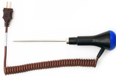
PT22M puikkoanturi · alue: -40 ... +250 °C · 1.0 m kierrekaapeli · T-tyyppin termoparianturi