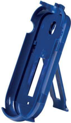
C20WB seinäkiinnike/pöytäpidike · sopii C4x ja BT4x sarjan mittareille