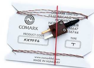
KX9556 taipuisa ilma-anturi · alue: -40 ... +150 °C · 2.0 m · T-tyyppin termoparianturi

Koko anturi- ja lisävarustevalikoima: www.comarkinstruments.com