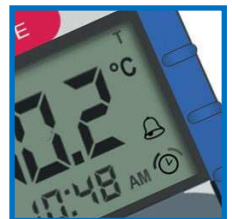
Ajastin ja hälytystoiminnot