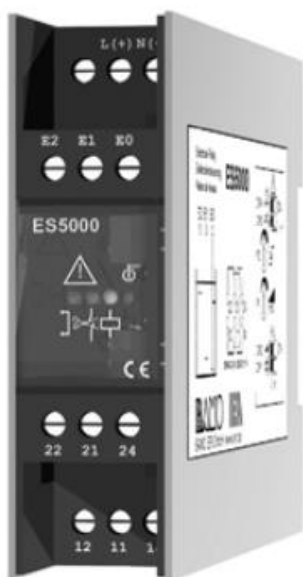
ES5000 Rele (myynti erikseen)