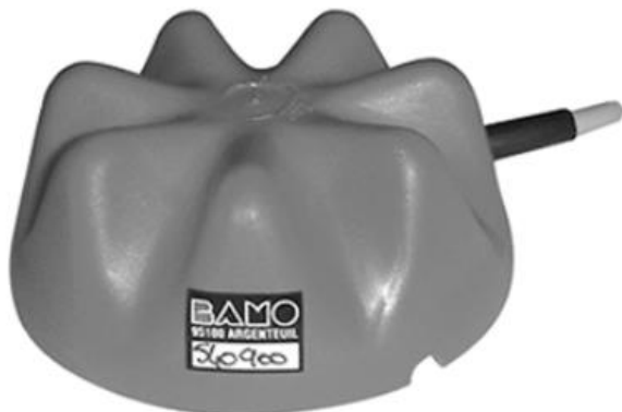
Lattiavuotohälytin BES (Käytettävä releen kanssa)